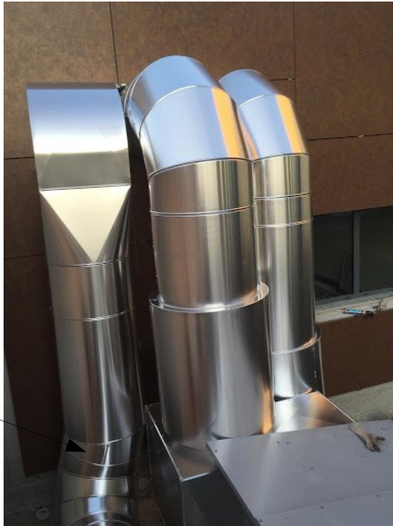
Raccord de gaine de ventilation

Votre entreprise doit réaliser un ensemble de ventilation pour le restaurant d'une cité scolaire. (photo ci-dessous)